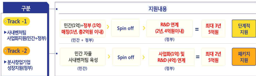
< 분사 전·후 단계별 지원내용 >