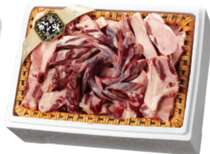
〈원산지:국내산〉 70,000원 정성 한우 꼬리반골세트 총 중량 4 kg(꼬리반골 4 kg)

하림의 삼계탕은 고향의 맛입니다. 어머니의 정성이 깃든 삼계탕, 장모님의 손맛이 가득한 영계백숙처럼 정성과 손맛이 살아있는 하림 삼계탕 세트로 주위에 감사의 마음을 전하세요.