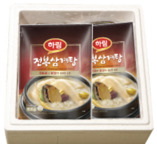
하림 전복삼계탕세트 48,000원 전복삼계탕 800 g X 3개