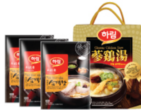
하림 반마리삼계탕세트 24,000원 하림 삼계탕(반마리) 600 g X 3개