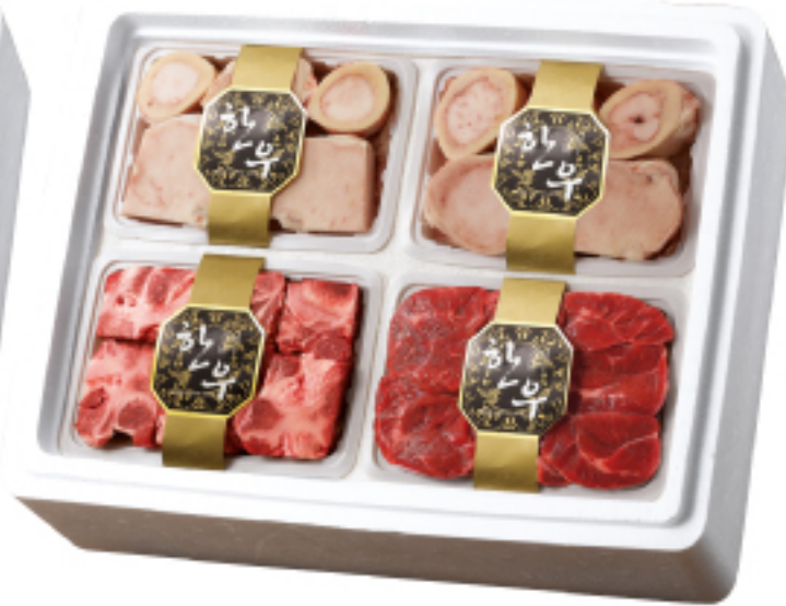
〈원산지:국내산〉 75,000원 정성 한우 효도세트 총 중량 3.2 kg(사골 800 g×2ea +잡뼈 800 g+사태 800 g)