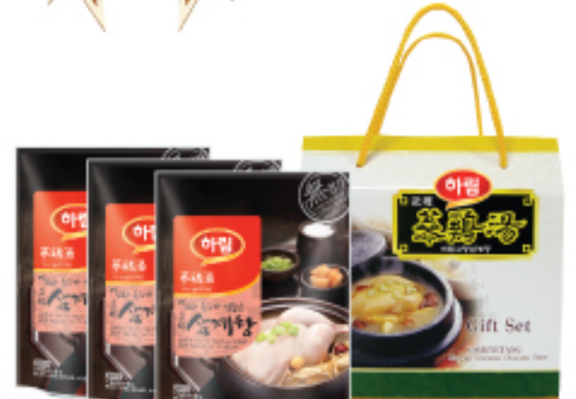
하림 고향삼계탕세트 30,000원 하림 고향삼계탕 800 g X 3개