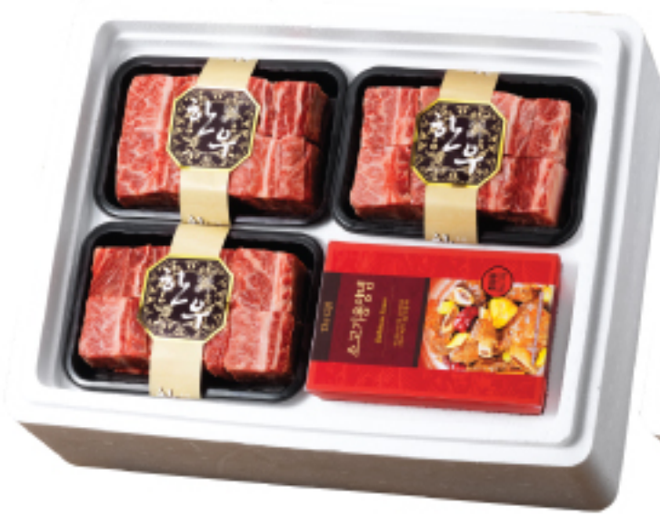
〈원산지:국내산〉 210,000원 정성 한우 1등급 갈비세트 총 중량 2.4 kg(갈비 800 g×3ea) 총 중량 600 g(소고기용 양념 200 g×3ea)