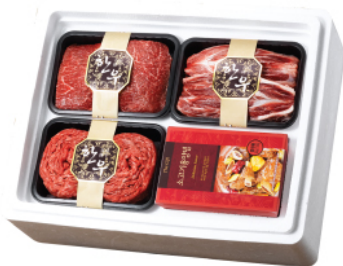
〈원산지:국내산〉 110,000원 정성 한우 정육세트 총 중량 2.1 kg(양지 700 g+사태 700 g+설도 700 g) 총 중량 600 g(소고기용 양념 200 g×3ea)