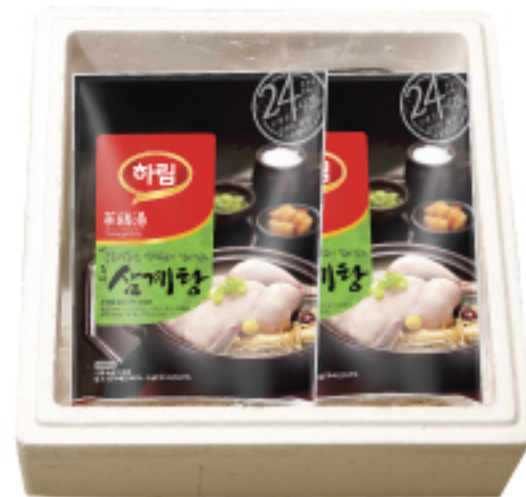
하림 즉석삼계탕세트 40,000원 즉석삼계탕 800 g X 4개